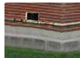
instalacja na zewnątrz